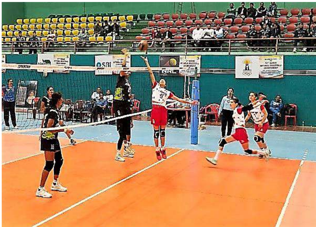
An action moment of match between Kerala and Himachal Pradesh women teams