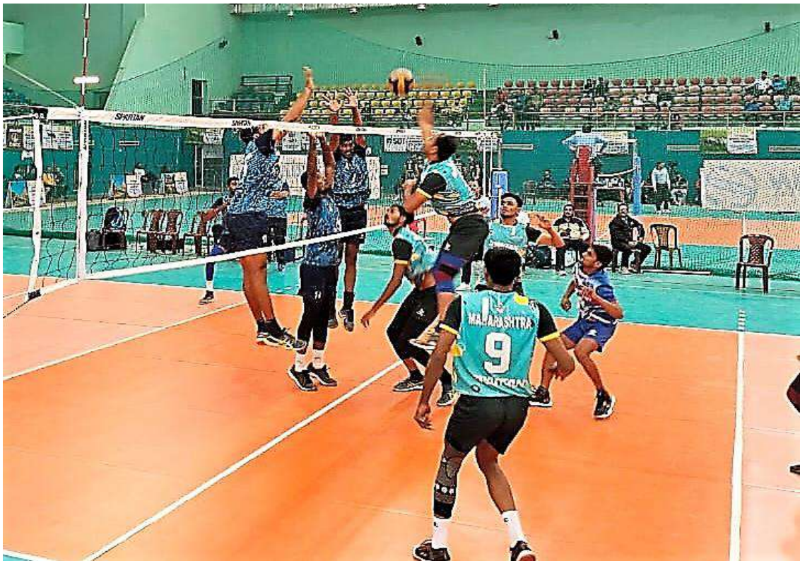
An action moment of match between Maharashtra and Andhra Pradesh men teams