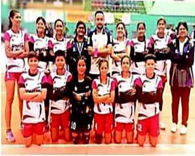
The Assam women's team after defeating Bihar.