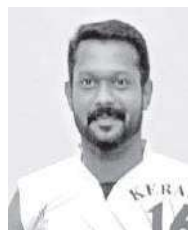
K. J. Kapil Dev (2010)