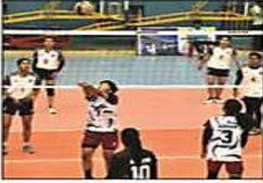
ৰাষ্ট্ৰীয় ভলীবলত অসম আৰু বিহাৰৰ মাজৰ খেলৰ এটা দৃশ্য

'আমাৰ অসম'ৰ টাফ বিপৰীত, ৪ ফেব্ৰুৱাৰী : ভাৰতীয় ভলীবল ফেডাৰেশ্বনৰ তত্ত্বাৱধানত তথা অসম চৰকাৰৰ সহযোগত অসম ভলীবল সন্থাই আয়োজন কৰা ৭১ সংখ্যক ছিনিয়ৰ ৰাষ্ট্ৰীয় ভলীবল প্ৰতিযোগিতাৰ আজি তৃতীয় দিনাও প্ৰতিটো পুৰুষ-মহিলা দলে কোৱাৰ্টাৰ ফাইনেলত নিজৰ স্থান নিশ্চিত কৰাৰ লক্ষ্যৰে গ্ৰুপৰ মেচত অংশ লয়। গুৱাহাটীৰ সৰসজীয়া ক্ৰীড়া প্ৰকল্পৰ কৰ্মীৰ নবীন গ্ৰুপ বৰদলৈ ইনড'ৰ ষ্টেডিয়ামত চলি থকা প্ৰতিযোগিতাৰ প্ৰতিখন গ্ৰুপ মেচে দলসমূহৰ বাবে অৰণ্যপন। প্ৰতিযোগিতাৰ নিয়ম অনুসৰি পুৰুষ শাখাত আছে ছটা গ্ৰুপ। ইয়াৰে গ্ৰুপ 'এ'ত আছে হাৰিয়ানা, তামিলনাড়ু, পঞ্জাব আৰু কৰ্ণাটক। আনহাতে, গ্ৰুপ 'বি'ত আছে বেংগাল, ছাৰ্ভিছেছ, বাজস্থান আৰু কেৰালা। এই দুটা গ্ৰুপৰ শীৰ্ষ তিনিটাক অৰ্থাৎ ছটা দলে পোনো পোনো কোৱাৰ্টাৰ ফাইনেলত প্ৰবেশ কৰিব। আনহাতে, কোৱাৰ্টাৰ ফাইনেলৰ বাকী দুটা নিৰ্বাচন ২৪টা দলৰ মাজৰ পৰা। মহিলাৰ শাখাতো এই পদ্ধতিৰে নিৰ্বাচন হ'ব কোৱাৰ্টাৰ ফাইনেলিষ্ট দল। মহিলাৰ 'এ' গ্ৰুপত আছে কেৰালা, হিমাচল প্ৰদেশ, তামিলনাড়ু আৰু বেংগ। আনহাতে, 'বি' গ্ৰুপত আছে বেংগাল, কৰ্ণাটক,