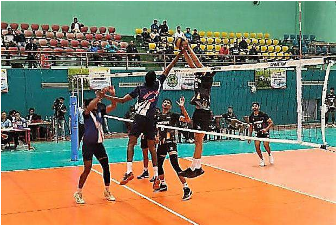
A moment of action during the match between Assam and Telangana men teams